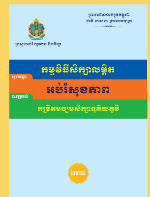
គម្របសៀវភៅដែលមានបញ្ចូលមេរៀនទាក់ទងនឹងនិន្នាការភេទ និងយេនឌ័រ