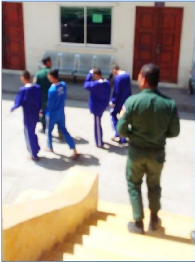
ម.ស.ម.ក ជនជាប់ចោទក្នុងសំលៀកបំពាក់ទណ្ឌិត

វិធាន ១១៥ នៃវិធានអង្គការសហប្រជាជាតិស្តីពីបទដ្ឋានអប្បបរមា